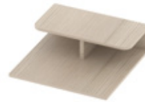
Magazine rack Porte-revues