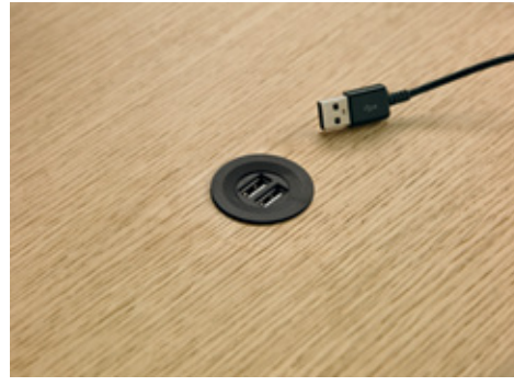
USB charging accessory Accessoire de chargement USB