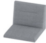
Seat with high backrest Assise avec dossier haut