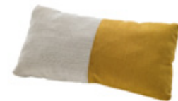
Pillow 25x48cm Coussin 25x48cm