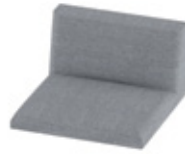
Seat with backrest Assise avec dossier