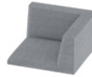
Corner seat Assise de coin