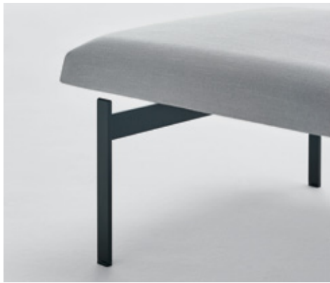
Metal legs Patas metálicas Piètement en metal