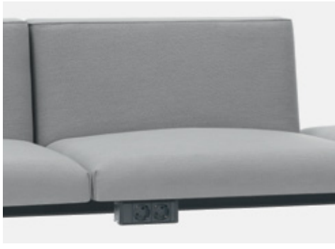
Plug with 2 sockets Barre de puissance à 2 prises