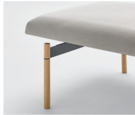
Wooden legs Patas de madera Piètement en bois