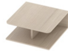
Collaborative table Plateau collaboratif