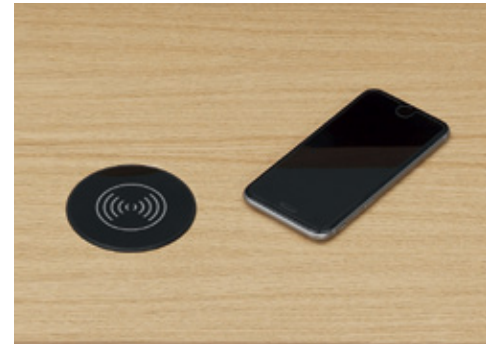
Wireless charging accessory Accessoire de chargement wireless