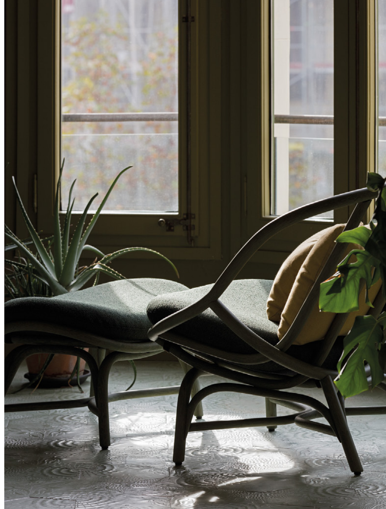
T030 Armadillo. Lounge chair / sillón. R06 verde oliva. Ito 38 T036 Armadillo. Footstool / banqueta. R06 verde oliva. Ito 38