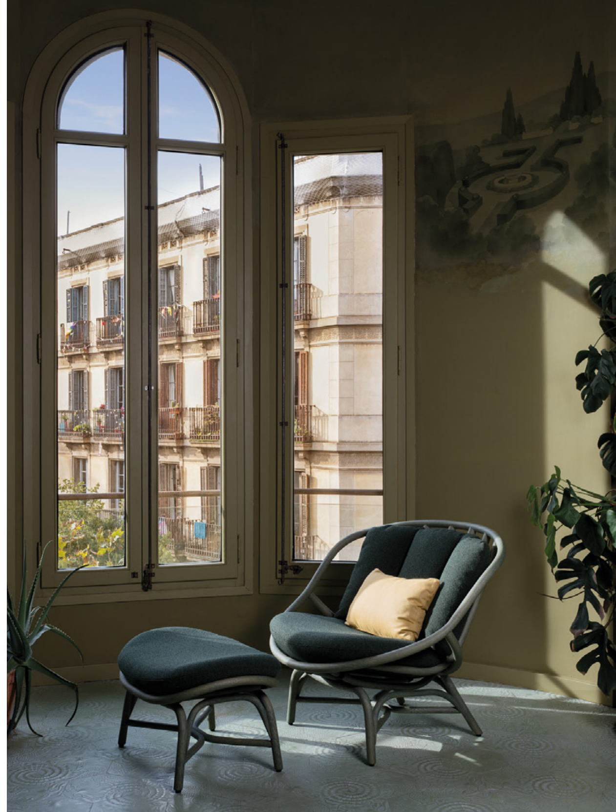
T030 Armadillo. Lounge chair / sillón. R06 verde oliva. Ito 38 T036 Armadillo. Footstool / banqueta. R06 verde oliva. Ito 38