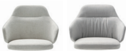
Tight upholstery Tapisserie tendue