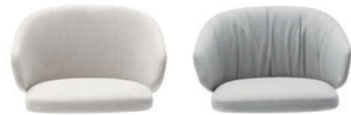
Tight upholstery Tapisserie tendue