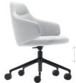
Swivel with gas lift. Swivel base on casters. Seat height adjustment with gas lift. Giratoire avec vérin à gaz. Piètement giratoire sur roulettes. Réglage de la hauteur d'assise via le vérin à gaz.