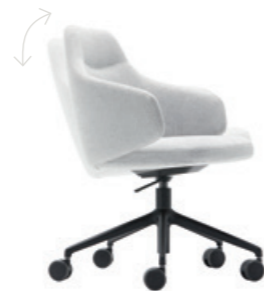
Tilt mechanism. Swivel base on casters. Seat height adjustment with gas lift. Tilt activation or locking in work position. Mécanisme basculant. Piètement giratoire sur roulettes. Réglage de la hauteur d'assise via le vérin à gaz. Mouvement de bascule avec verrouillage sur position de travail.