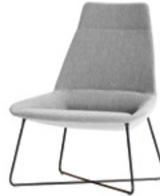
Dossier haut avec piétement en tige d'acier