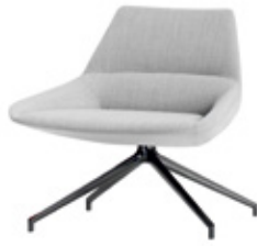
Low backrest with swivel base Dossier bas avec piétement giratoire