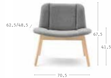
HIPPY 615 10,7 kg 0,50 m 3 2 pz