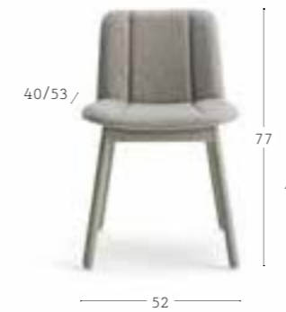
HIPPY 635 7,0 kg 0,33 m 3 2 pz