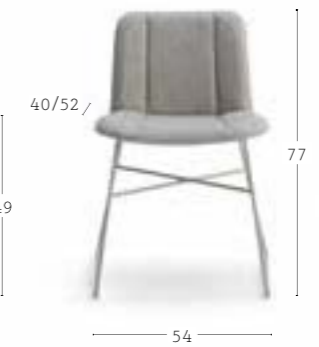
HIPPY 637 8,0 kg 0,33 m 3 2 pz