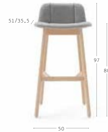
HIPPY 639 8,3 kg 0,29 m 3 1 pz