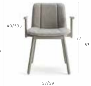
HIPPY 636 7,7 kg 0,26 m 3 1 pz