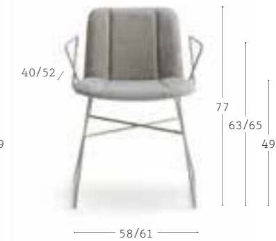
HIPPY 638 9,7 kg 0,26 m 3 1 pz